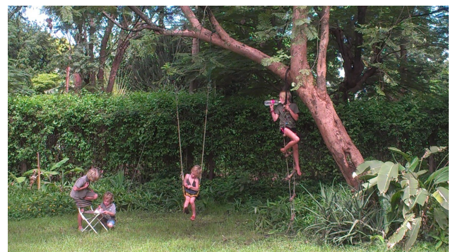
De jongste vier 'chillaxing' in de tuin

Hoe gaat het? Met mij gaat het wel goed. Ik heb het alleen wel heel erg druk gehad. Ik had 8 weken lang een project om te doen in de klas met een groepje van 4. Ik was wel heel erg blij met mijn groepje want wij waren een groepje van allemaal vrij slimme vrienden. Ons project ging over vuilnis en wat er daarmee allemaal gebeurt op onze aarde. Dit project heet de Exhibition en daar moet je dan 8 weken aan werken! Vermoeiend, maar leuk. Misschien heeft Willem het er ook wel over gehad vorig jaar, want nu zit hij al in M1. Het ging allemaal wel goed, maar soms liep het een beetje uit de hand ... Gelukkig kregen wij allemaal wel een school e-mail om in contact te blijven met