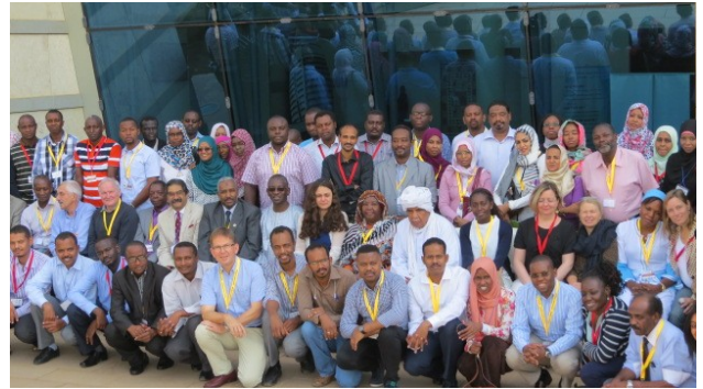
PanAfrican Association of Neurological Societies (PAANS)

Om neuroloog te zijn in dit gedeelte van de wereld is maar gedeeltelijk vergelijkbaar en invoelbaar voor iemand die zoals ik een mooie opleiding heeft gehad in welvarende en politiek rustige landen. Een voorbeeld waardoor dat weer eens duidelijk werd: toen de nieuwe bestuursleden van de PanAfrican Association of Neurological Societies (PAANS) werden verkozen tijdens de vergadering in Oeganda, werd door de vertrekkende Tunesische voorzitter tussen neus en lippen door verteld dat er ook 'n mooie