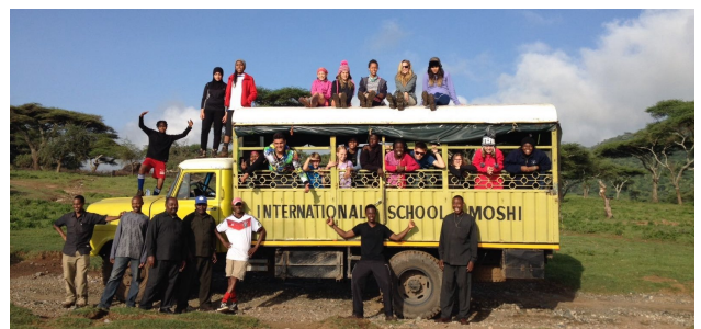
De schoolvrachtwagen tijdens een "outdoor pursuits" trip

Het verzoek van de onderzoeksleider was om een low tech lokale implementatie te bedenken, als tegenhanger van het Amerikaanse ontwerp dat er lag. Ik keek mijn ogen uit toen ik dat zag. Het verzenden van de herinnerings-SMS'jes zou als dienst afgenomen worden van de (Amerikaanse) marktleider op dat gebied. De