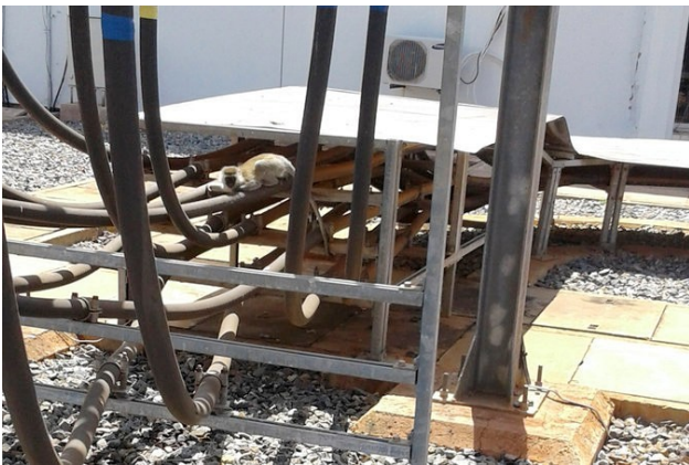
De aap met verstreckende gevolgen

Enfin, ik heb een low tech (en low cost) variant op het ontwerp gemaakt en in een lokaal netwerk van softwareontwikkelaars gezocht naar mensen met deze expertise. Tot mijn verrassing kreeg ik meerdere reacties van startende bedrijfjes die zich gestort hebben op de m-health markt. Het is hier nog geen Nairobi, dat zich ontwikkeld heeft tot regionale Tech Hub , of Kampala waar naar verluidt een levendige hacker scene ontstaan is, maar het begin is er.