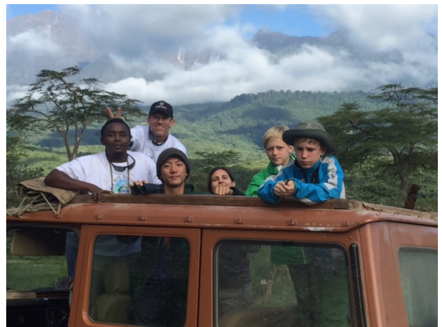
Het team van Willem klaar voor de Big Birding Day

Mijn eerste activiteit die dag was een on-line overleg met een collega bij KEMRI in Kenia. Hij was wat verlaat door problemen met de stroomvoorziening. Het bleek dat de avond ervoor in heel Kenia de stroom was uitgevallen, door een aap die op een transformator was